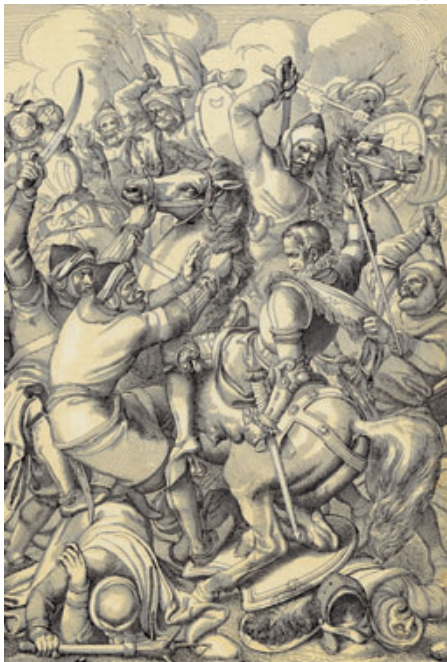
Ilustración de la época de la fatídica derrota del rey portugués Sebastian y sus tropas en la batalla de Alcazarquivir (1578).

Vázquez-Figueroa se aparta del imaginario popular lusitano y del misticismo secular portugués, que influyó a poetas como Luís Vaz de Camões o Fernando Pessoa, para forjar una aventura imposible mientras juega con los márgenes que le ofrece la leyenda, estirando al máximo los hechos. Pero, felizmente,